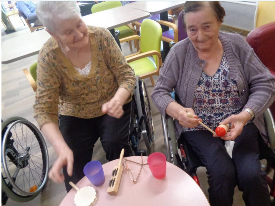
Utilisation des percussions pour battre la mesure sur des airs entraînants.