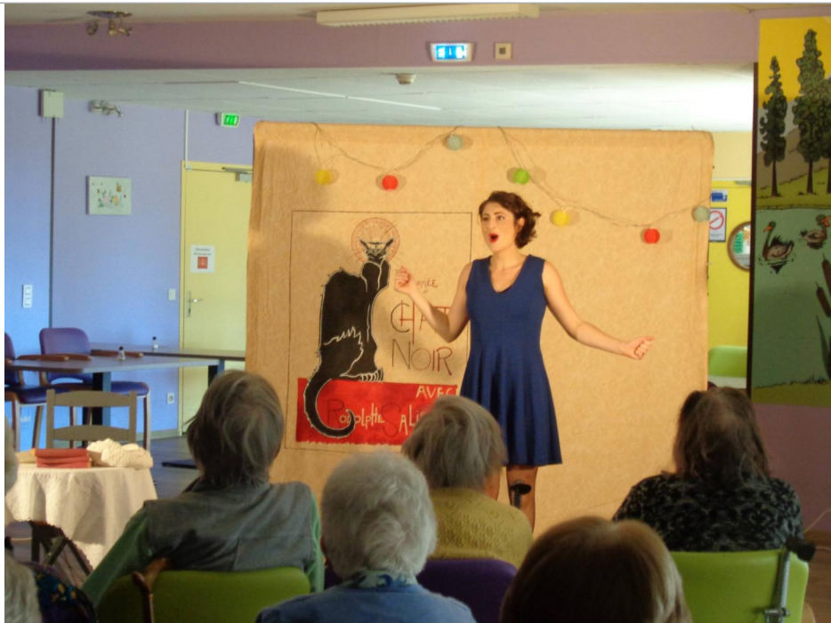
Spectacle de représentation au programme ce mois-ci "Le théâtre du chat noir"