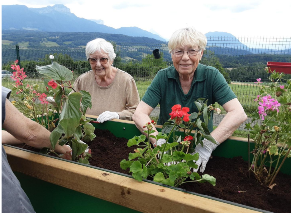
Encore du boulot pour les jardiniers