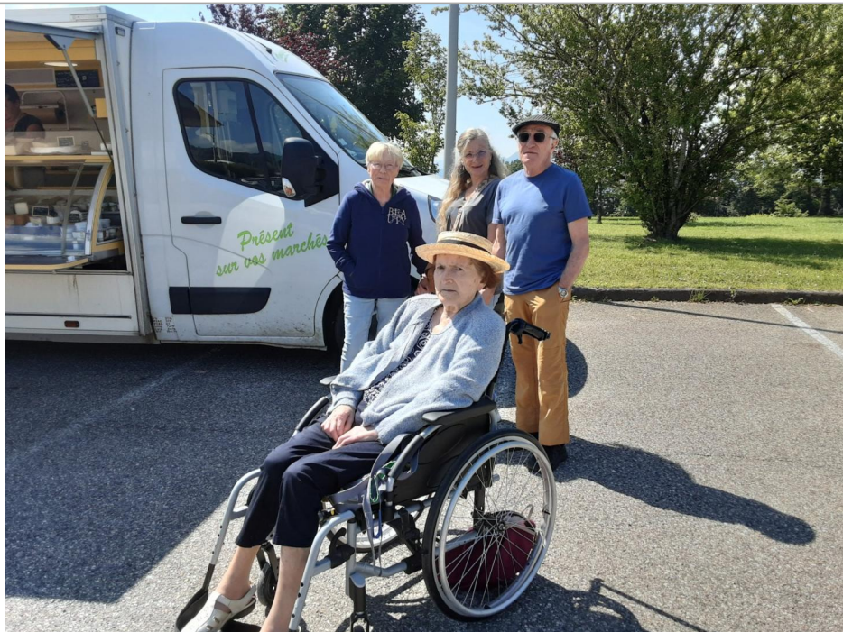
Un petit tour au marché !